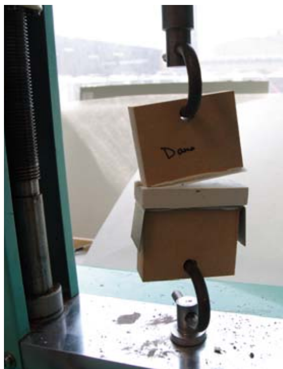
Dragprovning av provbit direkt ut klimatkammaren. Brottet sker i väven på MDF-skivan.

Efter 20 cykler börjar det uppkomma vitrost på plåten (se bild). Alla värden anges i Mpa.